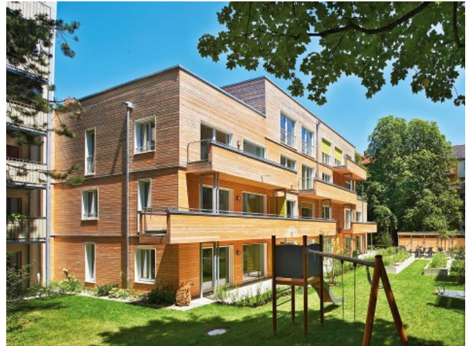
Bild 1. Nachverdichtung eines Innenhofs in der Mainzer Straße in München-Schwabing, Auftraggeber: GBW AG, Holzbau: Anton Ambros GmbH