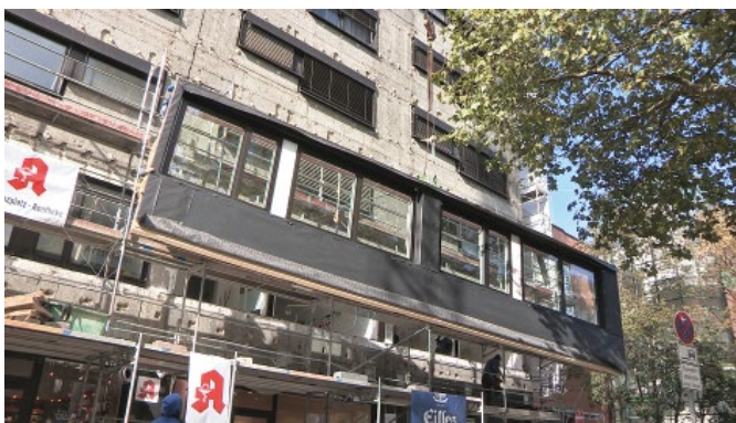
Bild 4. Donnersbergerstraße: Sanierung mit werksseitig vorgefertigten Fassadenelementen