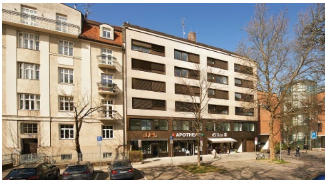
Bild 5. Das sanierte Gebäude in der Donnersbergerstraße, Architekten: Braun Krötsch, Holzbau: Anton Ambros GmbH

elementen entschieden hat, war nach Ansicht der Architekten gleich in mehrfacher Hinsicht ein Glücksgriff. Die ca. 3 m x 13 m großen Elemente wurden inklusive ökologisch hochwertiger Zellulosedämmung, Fenstern, Vorrichtungen für den Sonnenschutz und Fassadenbekleidung aus Hopferau zur Baustelle in München transportiert. So konnte die gesamte sechsgeschossige Fassade in nur sechs Tagen montiert werden. „Bei der konventionellen Methode hätte die Umbau ein halbes Jahr gedauert“, ist sich Stefan Krötsch sicher. Unmittelbar nach dem Abbruch der alten Fenster wurde das Fassadenelement samt den neuen Fenstern mit Stahlwinkeln am Bestand fixiert und mittels eingepressten Buchenholzdübeln quasi wie ein Legostein auf das darunter liegende Element gesteckt, so dass die Wohnungen meist nicht länger als eine Stunde ohne Fenster blieben. „Viele Bewohner“, erzählt der Architekt, „verfolgten den Montagevorgang interessiert aus dem Inneren ihre Wohnung.“ Der Baustellenverkehr wurde auf ein Minimum reduziert.