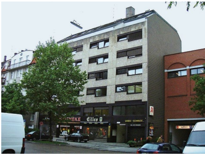
Bild 3. Sanierung eines Wohn- und Geschäftshauses in der Donnersbergerstraße in der Münchner Innenstadt – Zustand vor Beginn der Bauarbeiten